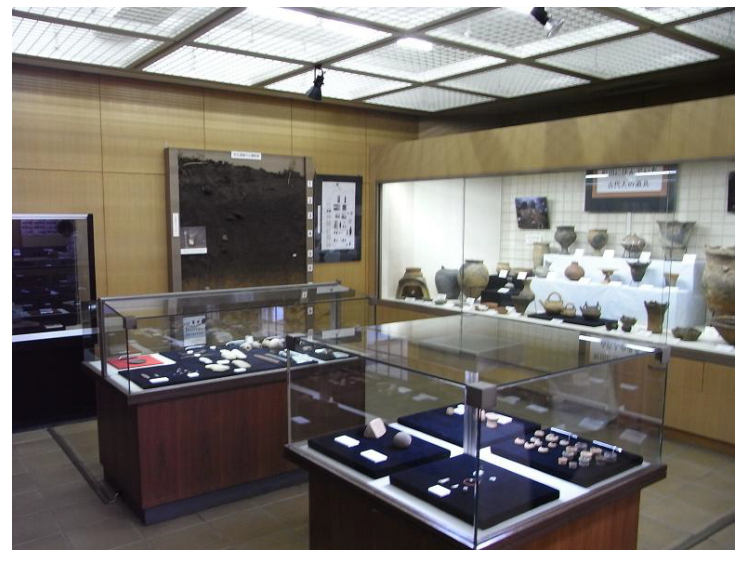
【写真＝】小山田にある町田市考古資料室。縄文土器など20万点が保存されています。

小児救急医療の充実を求めた質問について、市民病院事務長は、「初期救急をおこなうには、さらに医師3人が必要。小児科の常勤医確保に努力したい」と答えました。